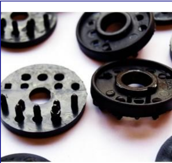
Connecteurs Simples (x... 25,00 € TTC _