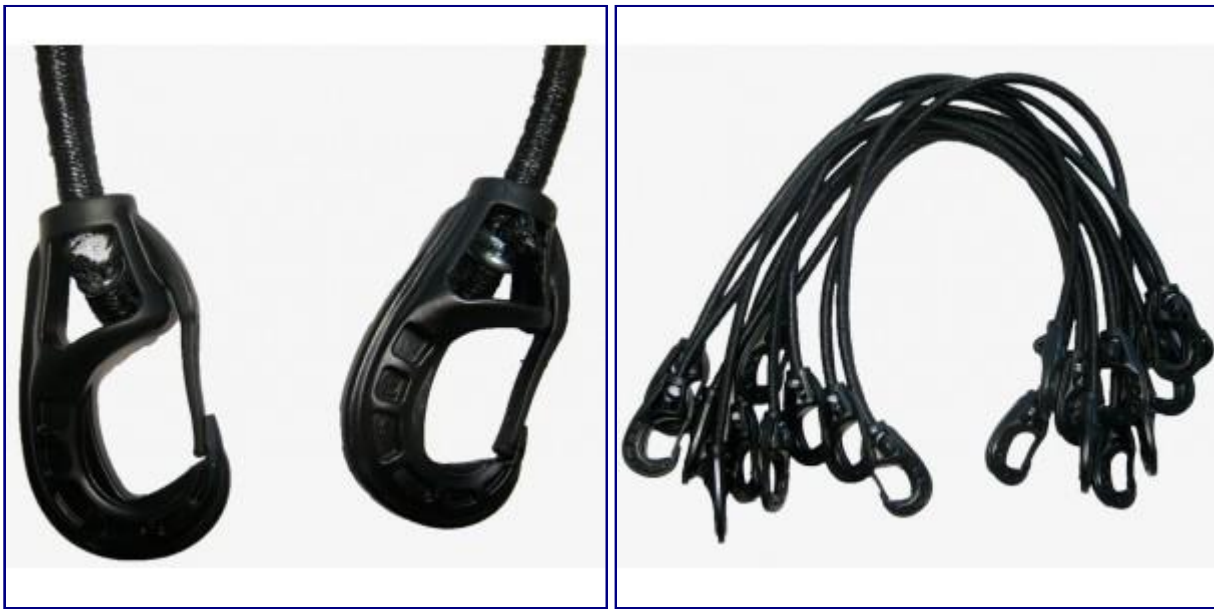
• Tendeurs 2 mousquetons... À partir de 11,90 € TTC